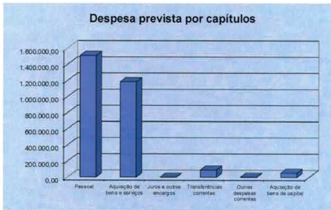
Gráfico n.º 2