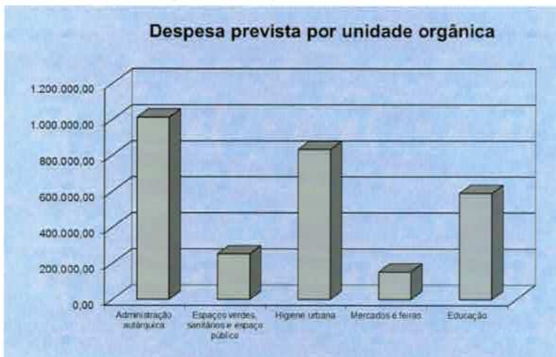
Gráfico n.º 3