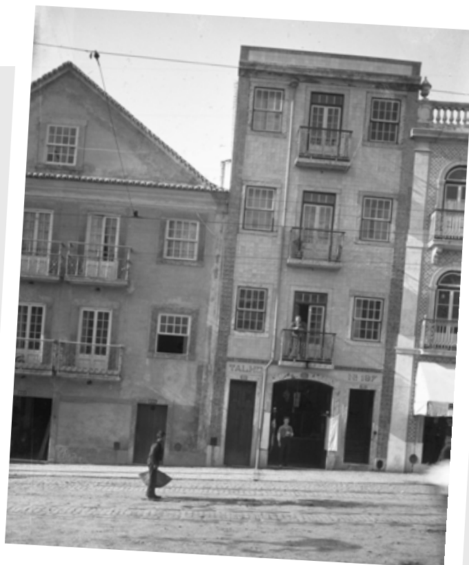
RUA DE SÃO BENTO

Na imagem vemos o prédio onde, mais de um século depois, viveria Amália Rodrigues e onde hoje está instalada a Fundação que tem o nome da fadista.