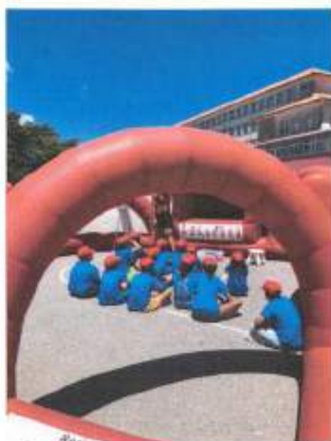
Figura 4- Escola de Valores com a Fundação Benfca