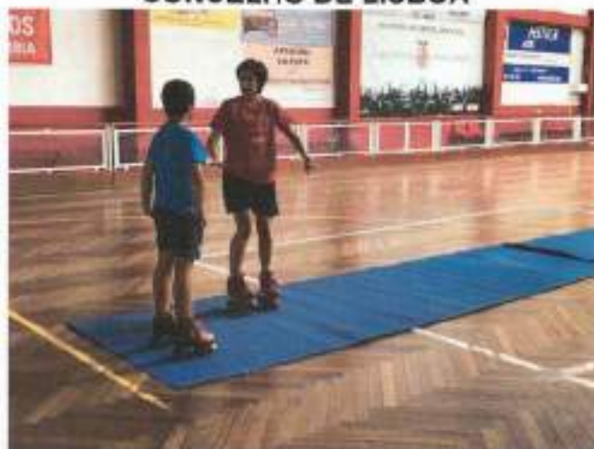
Figura 3 - aula de patinagem com o CACO