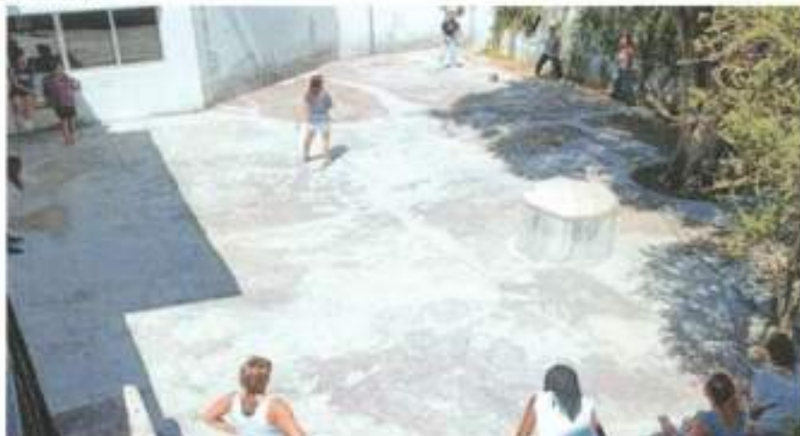
Figura 1- Formação Qualificação de Competências básicas para auxiliares de ação educativa