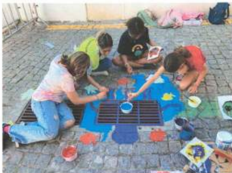
Figura 5 - pintura das sargetas no âmbito do projeto Eco-Freguesias