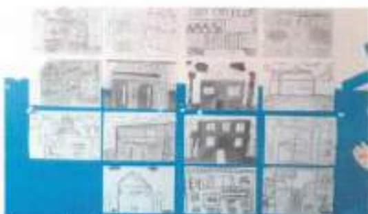
A escola do futuro