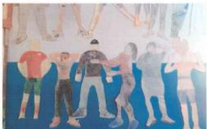
Nós e a escola