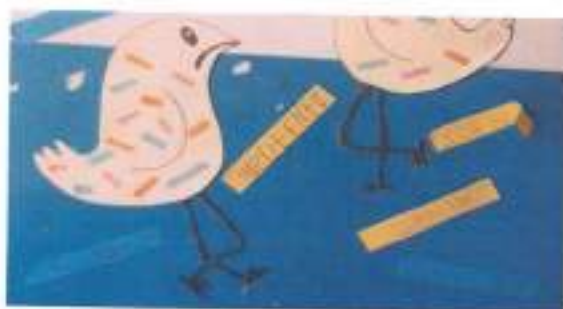
O Pássaro da Alma

Na última semana de aulas os alunos montaram uma exposição no átrio da escola para que os encarregados de educação pudessem visitar. Nesta exposição colocaram-se muitos dos trabalhos realizados ao longo do ano letivo.