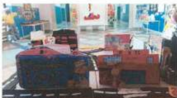
A Cidade e o bairro