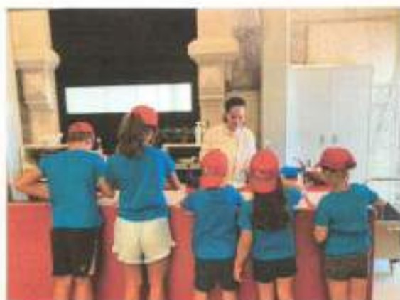
Figura 2 - workshop de culinária com a Escola de Turismo